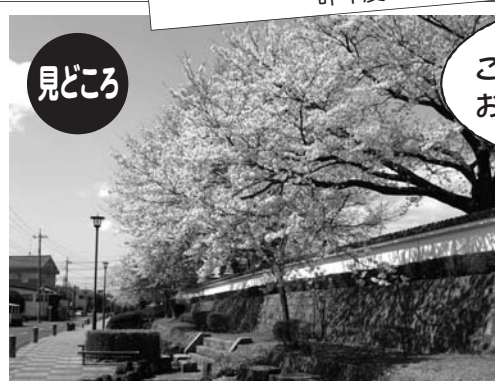
結城小学校築地塀