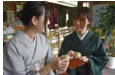
工芸品&和菓子…5, 6, 7P