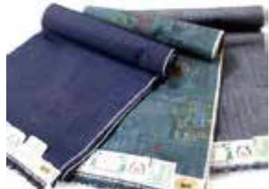
伝統的工芸品 結城紬

結城市の北部市街地は、中世の城下町の町割りが今に引き継がれ、お寺や寺社・見世蔵など歴史的な建物が多く現存する風情のある情景が特徴です。また、結城紬をはじめとする桐製品などの伝統的工芸品や日本酒・味噌・醤油づくりなど伝統的な地場産業が根づいており、晩秋の休日、歴史と文化を肌で感じることができます。きものを着て、見て、感じていただけるイベントを是非ご体験ください。