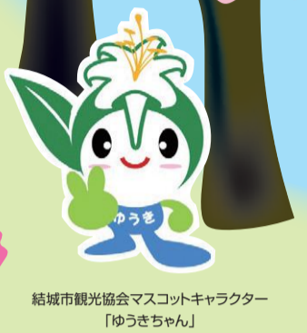
結城市観光協会マスコットキャラクター「ゆうきちん」